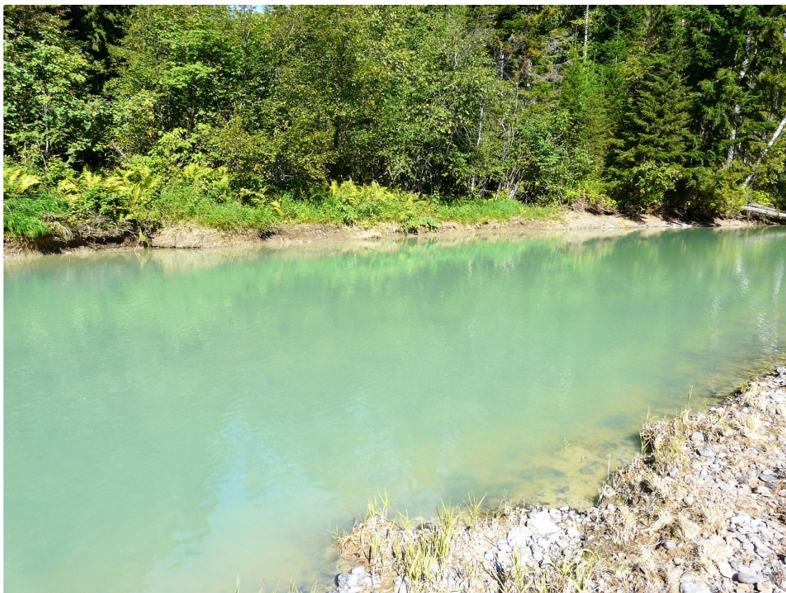
В воде слизевидный осадок